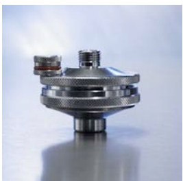
Bakterienfilter 0331020 mit Membran-Set 0331030

optionales Zubehör für Flowmeter Direkt und Schiene