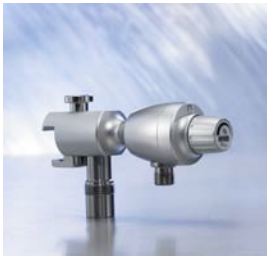
Einfache Ausführung Abb. 0 - 15 l/min O 2 660-0410