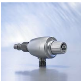
Einfache Ausführung Abb. 0 - 15 l/min O 2 660-0400