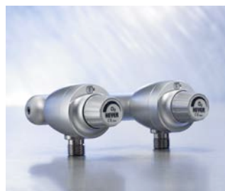
Doppelte Ausführung Abb. 0 - 15 l/min O 2 660-0420