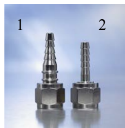
Schlauchadapter 5192512 ( 1 ) und 5192511 ( 2 )