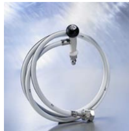
ISO 6600117 / Neutral 6600116

optionales Zubehör für Flowmeter Direkt und Schiene