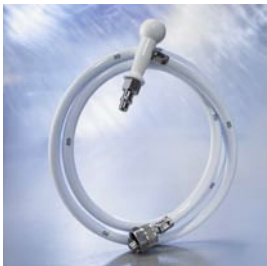
ISO 6600107 / Neutral 6600106