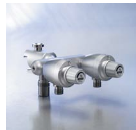
Doppelte Ausführung Abb. 0 - 15 l/min O 2 660-0421