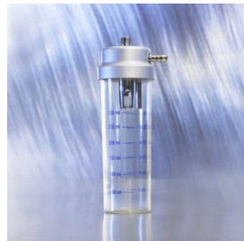
Sekretauffangglas kpl. 0,3ltr (Sicherheitsvorlage) 660-0275