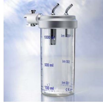
Sekretauffangglas 1,0 l Schiene 6600255