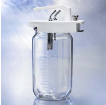
Sekretauffangglas Schiene mit Bajonettverschluss