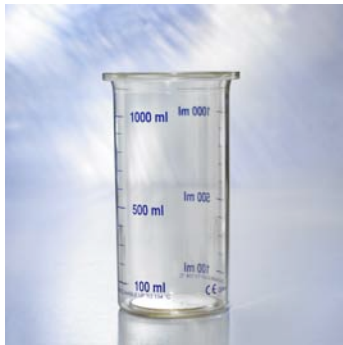
Ersatzglas 1,0 l 5533800