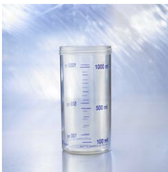
Ersatzglas 1,0 l mit Gewinde 6600251