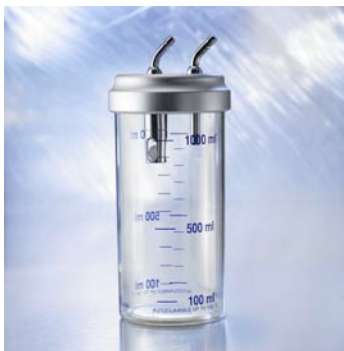
Sekretauffangglas 1,0 l Tragegestell 6600265