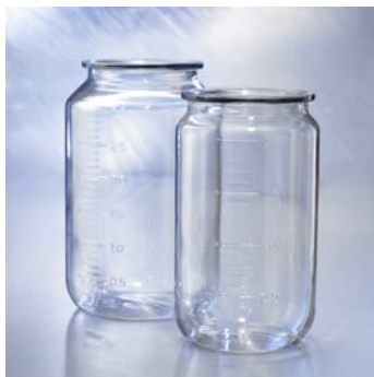
Ersatzglas 2,0 l 5533815 Ersatzglas 3,0 l 5533820