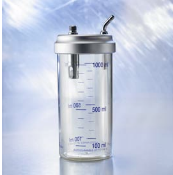
Sekretauffangglas 1,0 l Direkt 6600250